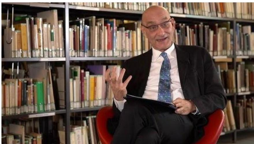
Con le principali istituzioni culturali e i ragazzi di Prato comunità educante incontri per parlare di migrazioni, moda sostenibile, dittature e tanto altro

Con le principali istituzioni culturali e i ragazzi di Prato comunità educante incontri per parlare di migrazioni, moda sostenibile, dittature e tanto altro.